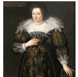
Magdeleine de Bonne duchesse de Créquy