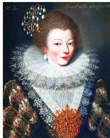
Marie Vignon duchesse et Connétable de Lesdiguières