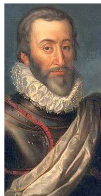
François de Bonne Duc de Lesdiguières Connétable