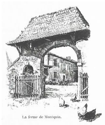
La ferme de Montquin.

Et vers 16h30 nous irons découvrir la ferme de Montquin, à Maubec, (à quelques minutes de Bourgoin) où Jean-Jacques Rousseau a vécu en 1769 et 1770.