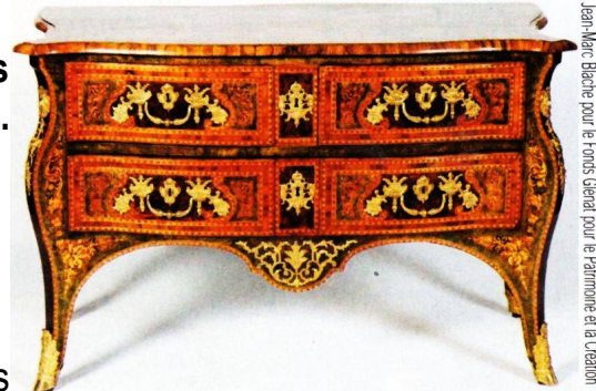
Jean-Marc Bache pour le Fonds Général pour le Patrimoine et la Création