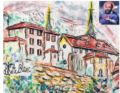
Eglise St André, chapelle du Parlement