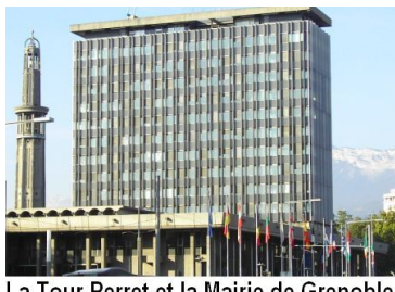
La Tour Perret et la Mairie de Grenoble

Ce patrimoine grenoblois original mérite d'être mieux connu pour être apprécié à sa juste valeur.