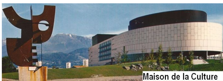
Maison de la Culture