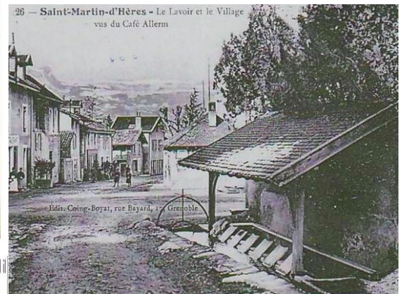
Edin. Coing-Boyat, rue Bayard, Grenoble

nous montre un événement important dans la vie de Martin, catéchumène, quand il partagea sa chlamide avec un pauvre à demi nu aux portes de la ville d'Amiens.