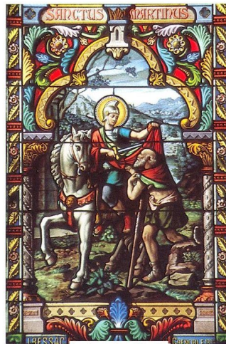
Le bas du vitrail

nous montre un événement important dans la vie de Martin, catéchumène, quand il partagea sa chlamide avec un pauvre à demi nu aux portes de la ville d'Amiens.