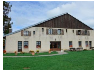
L'auberge Le Sillet à Longcochon

Nozeroy (Jura), cité comtoise de caractère est la ville des Sires de Chalon . C'est Jean, dit l'Antique ou le Sage , qui l'a fondée au XIIème siècle à l'extrémité d'un éperon rocheux. Les Comtes de Chalon, à tour de rôle, ont embelli la ville : un château appelé la « perle du Jura », une collégiale placée sous le vocable de saint Antoine avec un chapitre de chanoines, des remparts, des citernes d'eau, des moulins, une halle aux grains, des établissements religieux (Cordeliers, Annonciades, Ursulines), enfin, un hôpital Sainte Barbe construit en 1481.