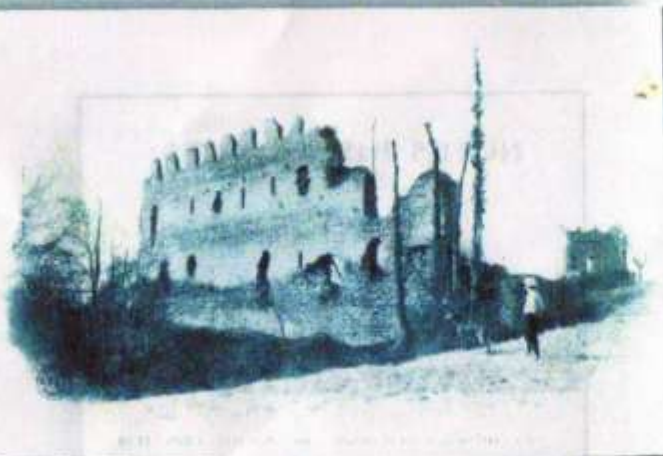
LA GRANDE MURAILLE.