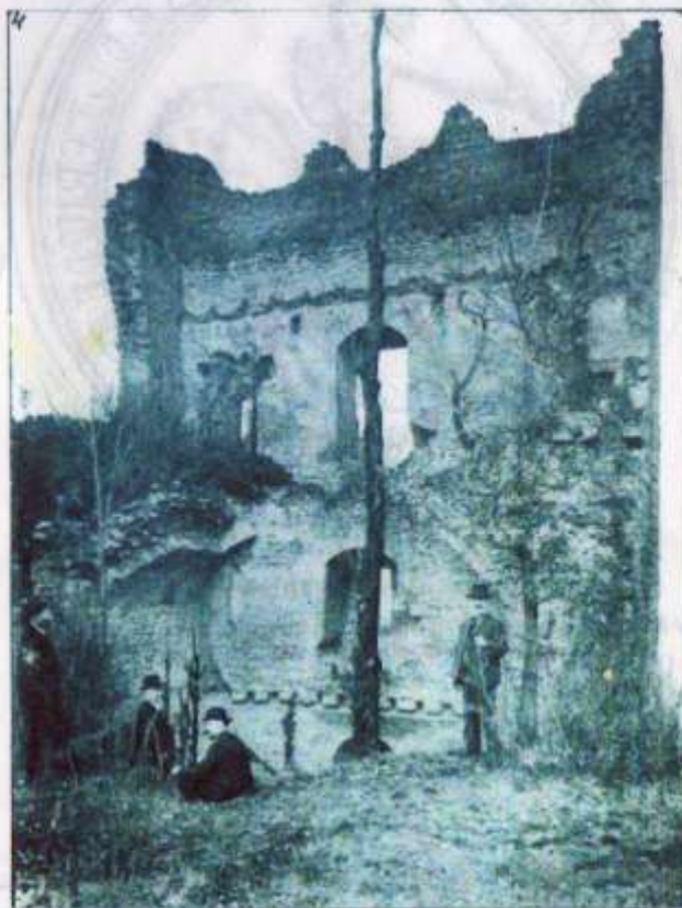
LA TOUR CARRÉE, VUE INTERIEURE.

Ouvrage mis à disposition lors du centenaire le 16 septembre 2018 à Beauvoir