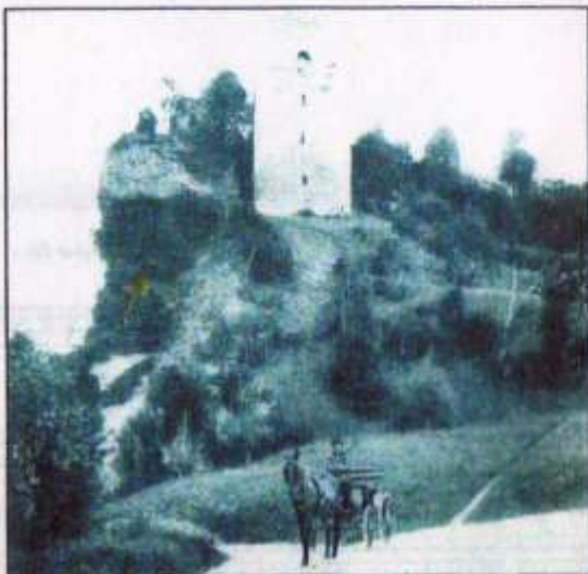
RUINES DU CHÂTEAU DELPHINAL. La Tour carrée. Vue extérieure.