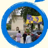
CONFÉRENCES, SORTIES ET EXPOS